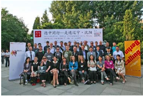
Foto: Delegation „Deutschland und China – Gemeinsam in Bewegung“ im Juni 2009

Mit „Kira“, „SuidAkrA“ und „Vorzeigekinder“ traten drei von der Initiative Musik geförderte Bands auf dem dortigen Popfestival auf.