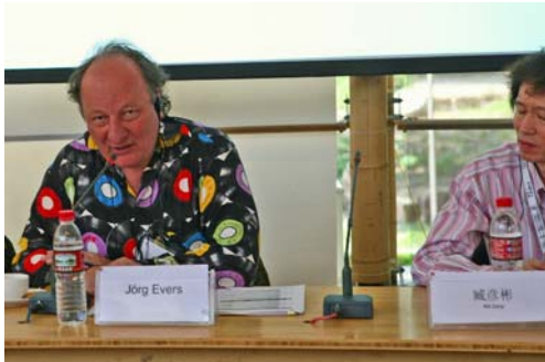
Foto: Jörg Evers (l.) für die Initiative Musik auf dem Panel „Veröffentlichung deutscher Tonträger in China“

Gedankenaustausch besteht. Die Verankerung des Anspruchs auf angemessene Vergütung der Urheber und Rechteinhaber gegenüber den Nutzern geistigen Eigentums im Bewusstsein der Bevölkerung und der politischen Entscheidungsgremien, sollte – und das wurde von chinesischer Seite teilweise vehement unterstützt – gerade auch im Interesse der chinesischen Rechteinhaber, Urheber und Produzenten unbedingt voran getrieben werden.