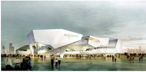
Foto: Deutscher Pavillon auf der EXPO 2010 in Shanghai, China

präsentieren. Die Bundesländer-Schwerpunkte dauern maximal eine Woche und umfassen Beiträge von überregionaler Bedeutung ebenso wie regionale Spezifika. Von deutscher Seite haben bereits einige Bundesländer ihre Auftritte mit Popmusik bereichert, die Vorbereitungen