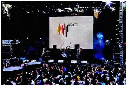
Foto: Konzert der Initiative Musik in China

Spiegel-Online titelt dieser Tage: „Chinas Wirtschaftswachstum übertrifft Erwartungen“. Und auch wir können Erfreuliches in Zusammenhang mit der Volksrepublik berichten: Das Dialogforum „China als Zukunftsmarkt“, über das die Initiative Musik Geschäftskontakte von Unternehmen der Musikwirtschaft aus China und Deutschland anbahnen und