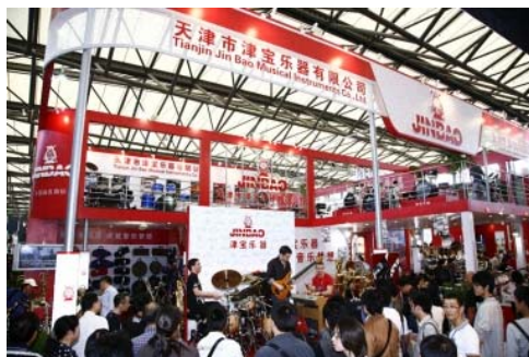
Foto: Music China, die größte Musikmesse Asiens

In diesem Zusammenhang kommt es erstmals zu einer Kooperation mit der Musikmesse Frankfurt. Als internationale Leitmesse für Musikinstrumente und Musikproduktion veranstaltet sie seit 2002 auch die größte Musikmesse Asiens, die Music China, mit.